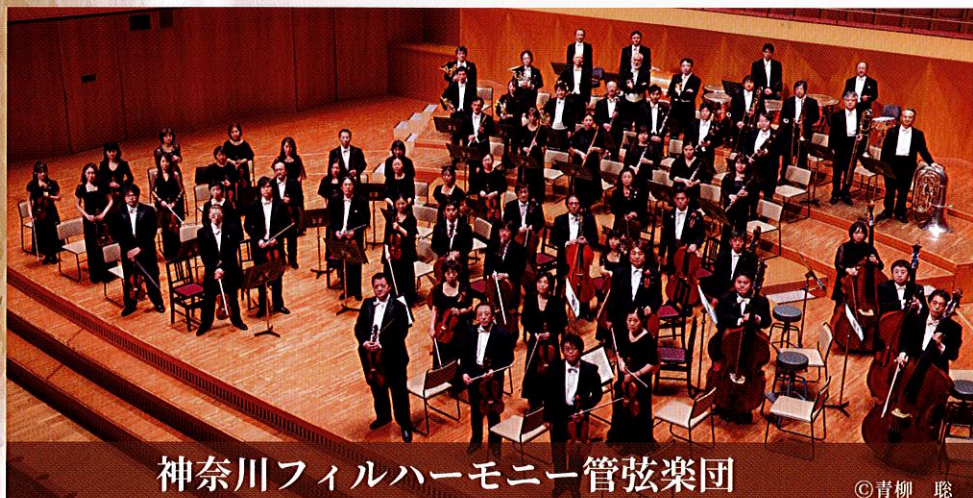
神奈川フィルハーモニー管弦楽団