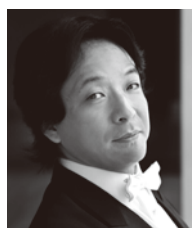
指揮 沼尻 竜典 (神奈川フィル音楽監督) Ryusuke NUMAJIRI, Conductor

2022年4月より神奈川フィルの音楽監督。これまで国内外数々のポストを歴任。ドイツではリュールベック歌劇場音楽総監督を務め、オペラ公演、リュールベック・フィルとのコンサートの双方において多くの名演を残した。ベルリン、ロンドン、パリ、モントリオール、シドニー等世界各国のオーケストラ、ケルン、ミュンヘン、ベルリン、バーゼル、シドニー等の歌劇場へも客演を重ねている。16年間にわたって芸術監督を務めたびわ湖ホールでは、ミハエル・ハンペの新演出による《ニーベルングの指環》を含め、ワーグナー作曲の主要10作品をすべて指揮した。14年にはオペラ《竹取物語》を作曲・初演、国内外で再演されている。17年紫綬褒章受章。