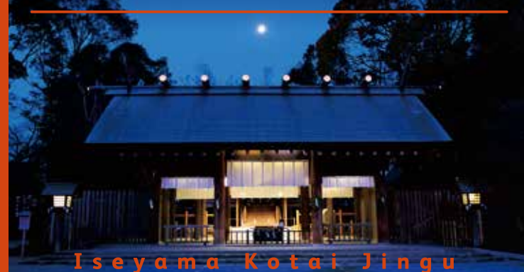
Ise-yama Kotai Jingu

伊勢山皇大神宮は1870年に創建され、2020年に創建150年を迎えました。御祭神は天照大御神。創建以来、神奈川の宗社・横浜の総鎮守として、横浜の街と港を見守り続けており、神奈川県内外、横浜市内外の方から広くご崇敬をいただいています。