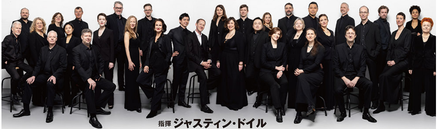
指揮 ジャスティン・ドイル (首席指揮者&芸術監督)