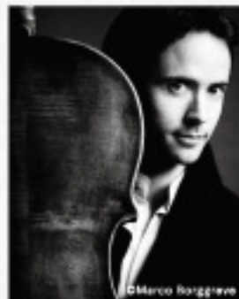
ジャン＝ギアン・ケラス(チェロ)