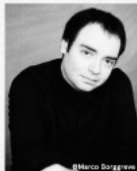
アレクサンドル・メルニコフ(ピアノ)